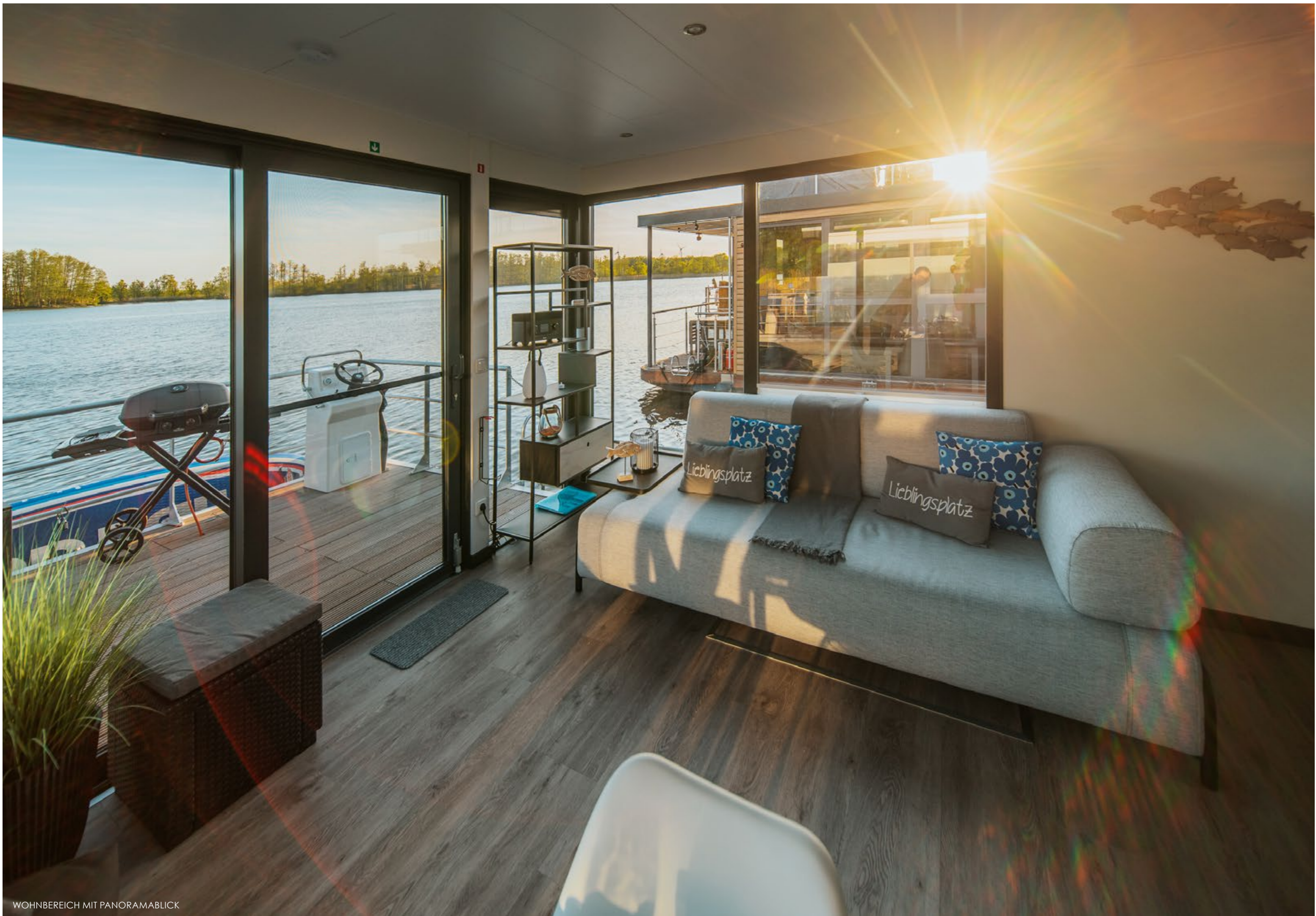
WOHNBEREICH MIT PANORAMABLICK